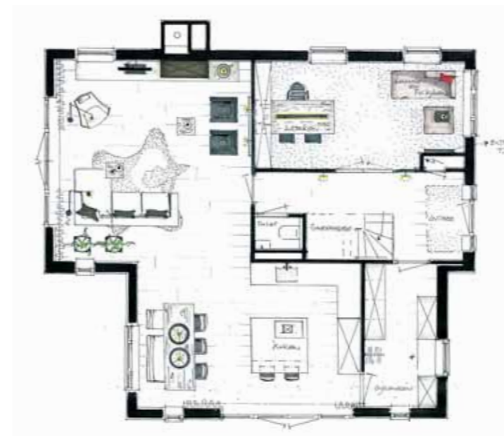
interieurimpressie type E begane grond